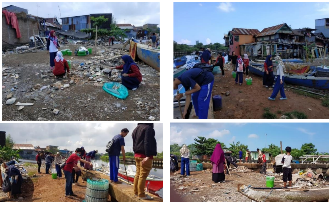
Gambar 5. Kegiatan gotong-royong membersihkan kanal bersama masyarakat dan mahasiswa