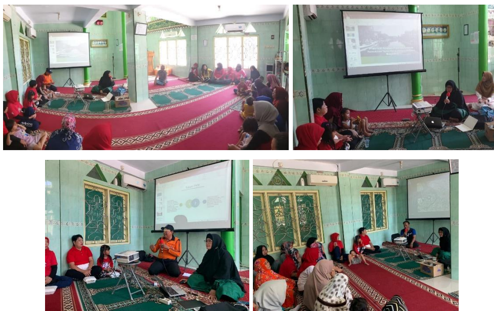
Gambar 3. Penyampaian Materi dan Umpan Balik