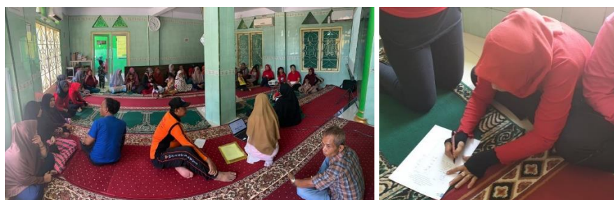
Gambar 2. Suasana Lokasi dan Registrasi Peserta

Kegiatan sosialisasi berisi penjelasan tentang pengarahannya penataan permukiman yang lebih baik dan sehat khususnya di kawasan Kanal Jongaya. Masyarakat dapat memahami tentang pentingnya kebersihan lingkungan agar masyarakat tetap hidup sehat dan dapat meningkatkan kualitas permukiman. Sosialisasi ini juga dapat memberikan pemahaman bagi masyarakat setempat yang tinggal dekat permukiman tepian Kanal Jongaya tentang pentingnya penataan lingkungan untuk menciptakan kawasan yang layak huni, layak kunjungan dan layak investasi. Hal ini dapat mendukung masyarakat agar dapat menghasilkan suatu produk/barang dari hasil keterampilannya yang dapat dijual sehingga secara tidak langsung mampu meningkatkan ekonomi masyarakat.