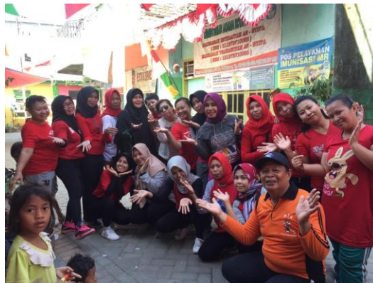
Gambar 4. Foto Bersama Peserta Sosialisasi