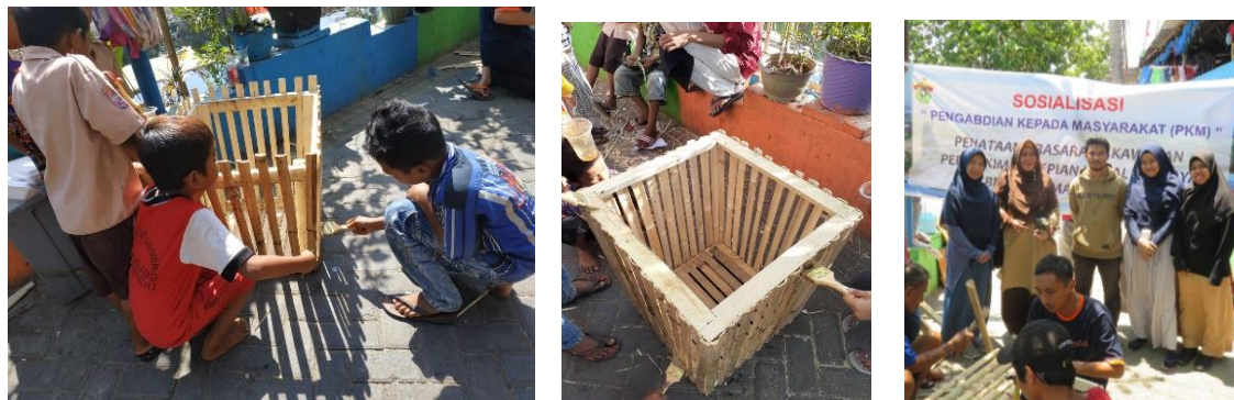
Gambar 6. Kegiatan membuat tempat sampah bersama masyarakat dan mahasiswa