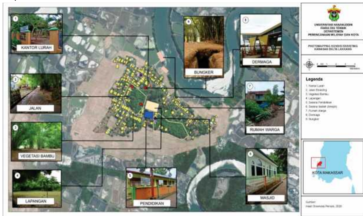
Gambar 2. Photomapping kondisi eksisting kawasan delta Lakkang

Untuk aksesibilitas, satu-satunya transportasi yang menghubungkan Lakkang dengan Kota Makassar yaitu dengan jalur perairan. Terdapat tiga dermaga yang biasa digunakan masyarakat setempat maupun pendatang, yaitu dermaga Kera-Kera di Universitas Hasanuddin, dermaga di dekat Jalan Tol Reformasi, dan dermaga di Kelurahan Pampang. Diperlukan biaya sekitar lima hingga 15 ribu rupiah untuk menggunakan perahu penyeberangan tersebut. Perahu tersebut juga dapat memuat kendaraan seperti motor atau sepeda untuk menyeberang dengan biaya lima ribu rupiah per kendaraan. Sarana yang digunakan dalam penyeberangan cukup unik. Perahu yang digunakan dikenal dengan nama Pincara' atau dua perahu yang disatukan sehingga tergabung menjadi satu perahu yang lebih besar denah lokasi pengabdian (Gambar 2).