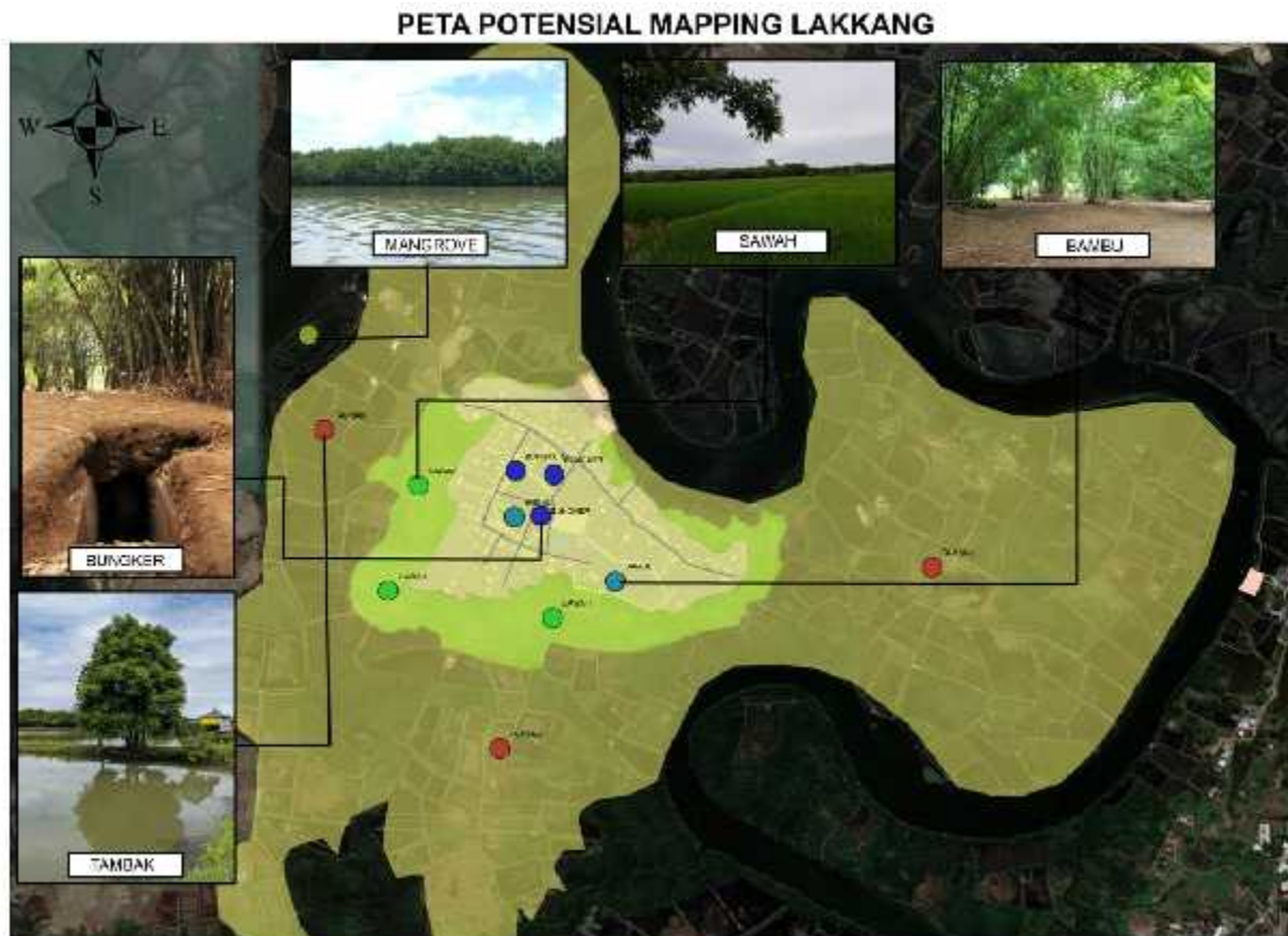
Gambar 4. Photomapping kondisi eksisting kawasan delta Lakkang