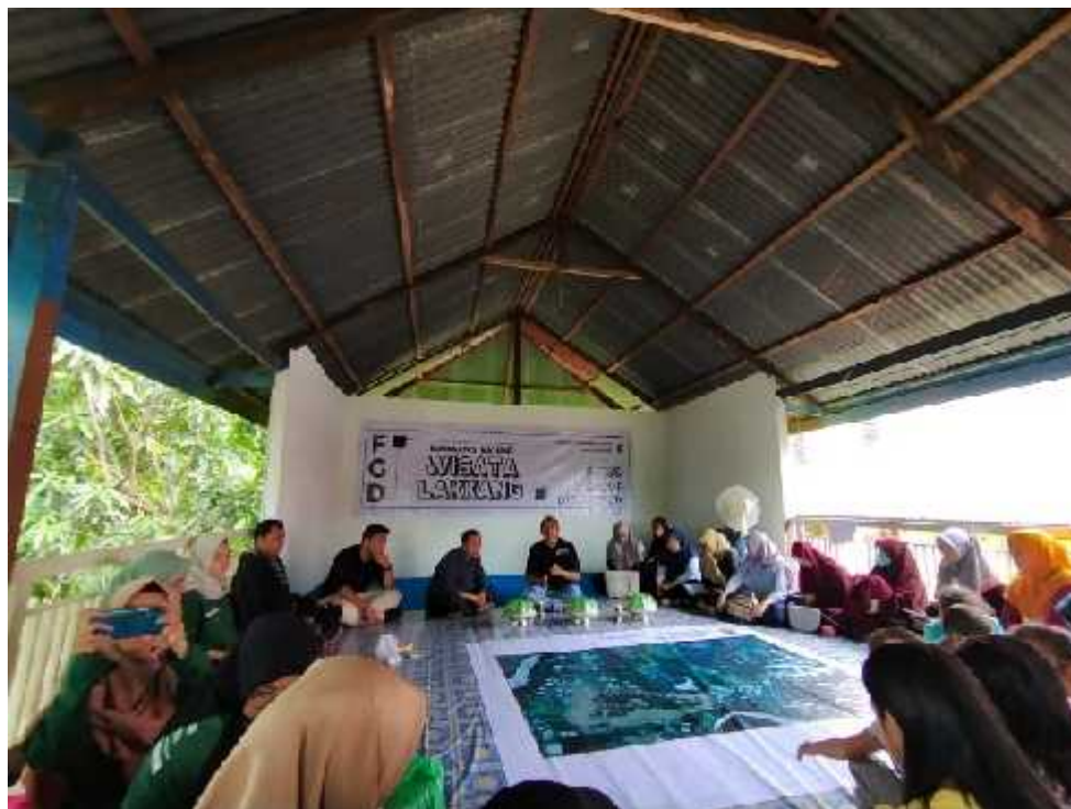
Gambar 3. Kegiatan FGD bersama masyarakat di kawasan wisata Lakkang

Berdasarkan hasil kegiatan FGD, permasalahan yang terjadi di Pulau Lakkang yaitu Air bersih susah di dapatkan, Air sumur bor rusak atau tidak dapat digunakan, Masih kurangnya WC umum atau tempat pembuangan sementara untuk wisatawan (RT 01 RW 01), Minimnya drainase di Lakkang menjadi kekhawatiran masyarakat, Kurangnya lampu jalan/lampu Lorong, Banyak jalanan rusak yang belum di renovasi ulang (RT 01 RW 02), Dermaga pulau Lakkang butuh WC umum, Banker perlu dibersihkan dan dirawat kembali untuk menarik wisatawan, Kurangnya tempat sampah untuk setiap rumah masyarakat di Lakkang, Bank sampah tidak beroperasi dengan baik, Banyak sampah berserakan dan bambu kering, dan renovasi dermaga Lakkang.