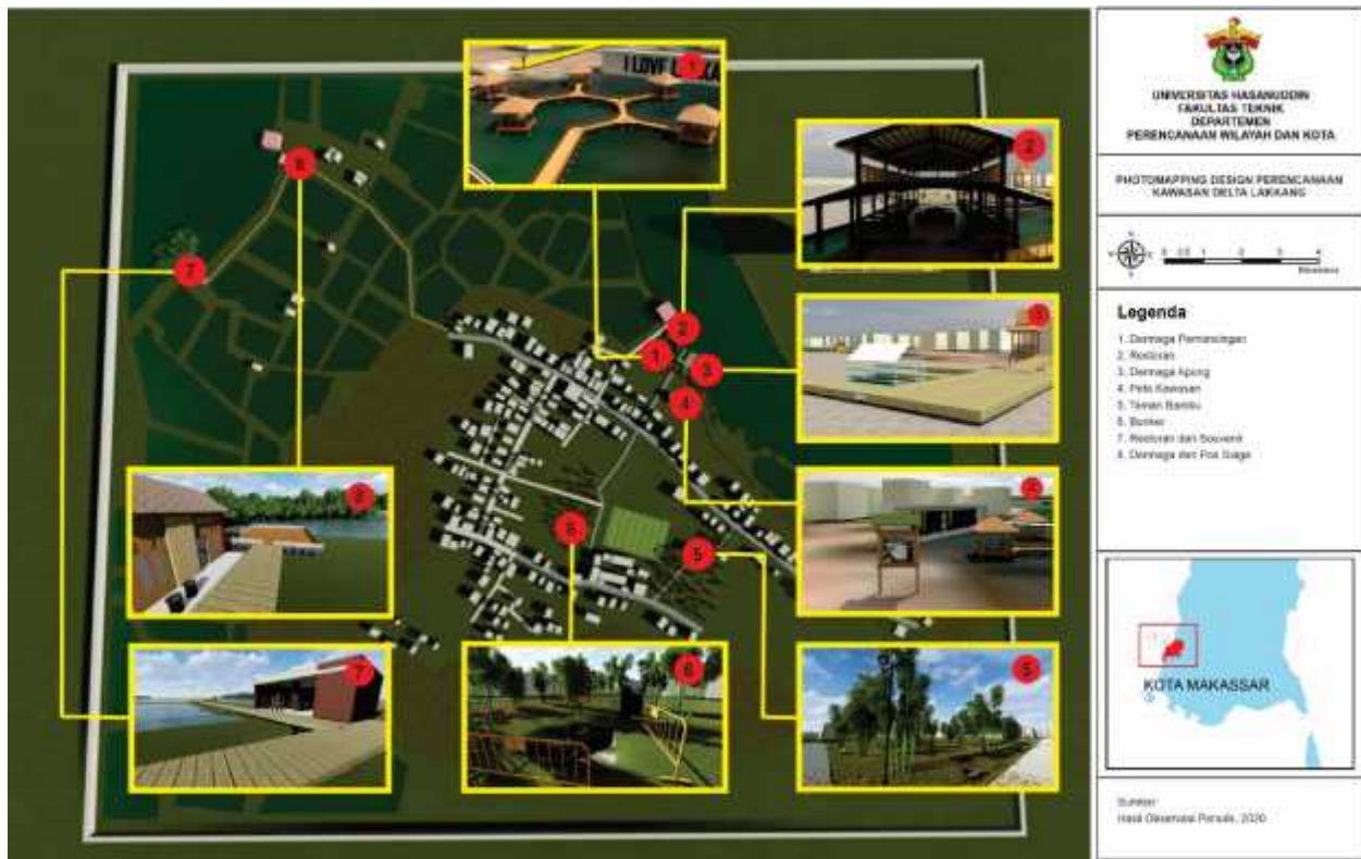
Gambar 5. Photomapping desain perencanaan delta Lakkang