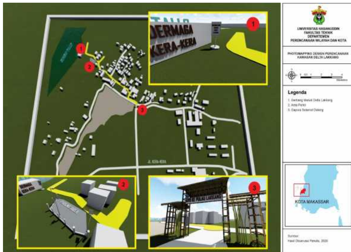
Gambar 6. Photomapping desain perencanaan delta Lakkang (2)