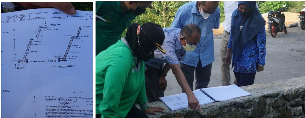
Gambar 3. Klarifikasi Desain oleh Tenaga Ahli dan pemangku kepentingan

Hal pertama yang dilakukan adalah mempelajari desain dan data-data teknis yang ada kemudian melakukan klarifikasi terhadap kondisi eksisting yang ada di lapangan. Kegiatan tersebut dapat dilihat pada tangkapan Gambar 3 berikut ini.