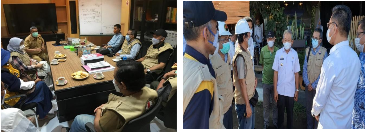
Gambar 4. Diskusi

Diskusi dan tanya jawab di lapangan memungkinkan komunikasi langsung yang efektif dalam mengenali kemampuan analisis dan metode pelaksanaan pekerjaan orang-orang yang bertanggungjawab selama masa konstruksi (Gambar 4). Penting untuk diketahui bahwa diskusi yang dilakukan tidak berupaya untuk mencari-cari kesalahan, namun untuk melihat semua aspek yang menjadi pemicu terjadinya bencana.