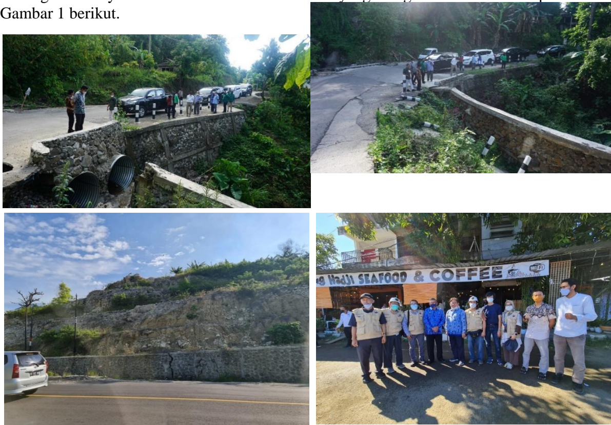
Gambar 2. Lokasi kegiatan

Tipe dinding penahan tanah Gravity Wall merupakan jenis DPT yang sangat banyak ditemui karena tergolong mudah dan murah dalam pelaksanaannya namun terbatas pada pengaplikasian tinggi lereng tertentu yaitu maksimal 6 m. Kondisi DPT yang mengalami kerusakan dapat dilihat pada Gambar 1 berikut.