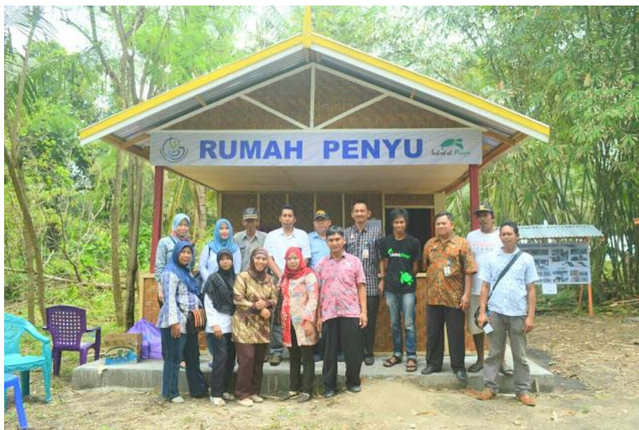
Gambar 1. Rumah Penyu yang didirikan oleh komunitas Penyu

Harapan besar Sahabat Penyu dapat menjadi pusat pendidikan dan konservasi penyu di Kabupaten Polewali Mandar secara khusus dan di Sulawesi Barat pada umumnya. Oleh karena itu, penyiapan sarana dan prasarana merupakan salah satu bagian dari upaya menuju pencapaian visi Sahabat Penyu. Salah satu skill yang diperlukan dalam komunitas ini adalah dengan melibatkan Teknologi Informasi untuk mengenalkan kegiatan pelestarian penyu ini. Salah satu teknologi yang dapat dikembangkan yaitu dengan sistem informasi komunitas berbasis website .