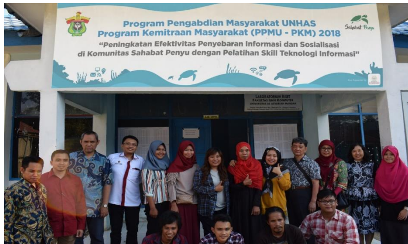
Gambar 5(c). Dokumentasi kegiatan