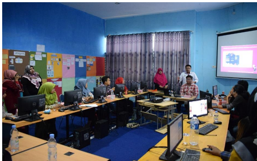
Gambar 5(a). Dokumentasi kegiatan

Dokumentasi kegiatan diperlihatkan pada Gambar 5 berikut dan publikasi pelatihan yang dipublikasi pada media online “Tribun”.