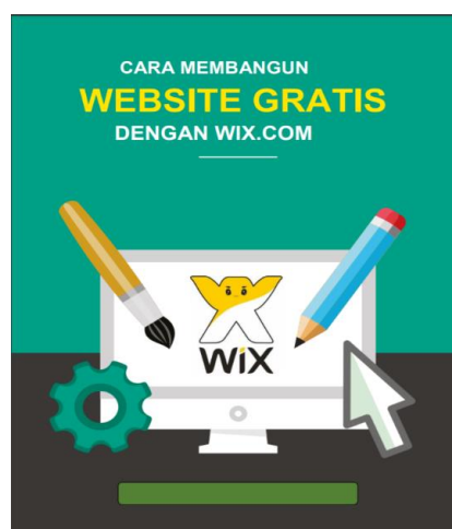
Gambar 3. Sesi 1: Pelatihan Pembuatan Website

Kegiatan pengabdian pada masyarakat di Komunitas Sahabat Penyu di Kabupaten Polewali Sulawesi Barat telah dilakukan pada Kamis, 2 Agustus 2018. Pelatihan pembuatan Web dihadiri oleh 10 orang anggota komunitas sahabat penyu. Pelatihan yang dilakukan dibagi dalam 2 sesi, yaitu pelatihan pembuatan website seperti yang ditunjukkan pada Gambar 3 dan pelatihan pembuatan media periklanan seperti pada Gambar 4.