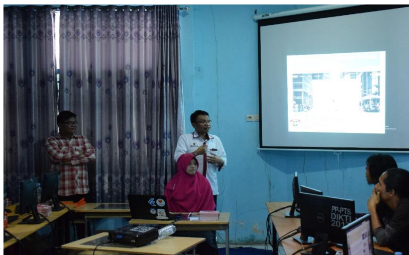
Gambar 5(b). Dokumentasi kegiatan