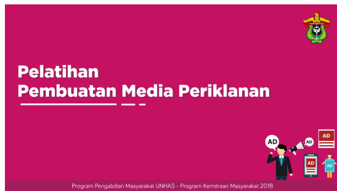
Gambar 4. Sesi 2: Pelatihan Pembuatan Media Periklanan.

Dokumentasi kegiatan diperlihatkan pada Gambar 5 berikut dan publikasi pelatihan yang dipublikasi pada media online “Tribun”.