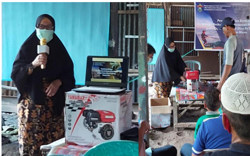
Gambar 5. Penjelasan dan Bimbingan Metode Perbaikan dan Perawatan Mesin Outboard