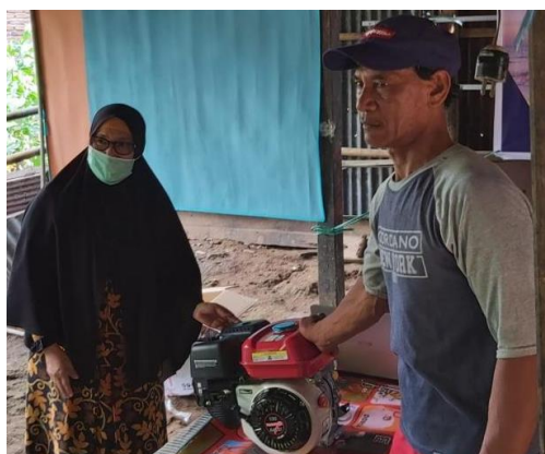
Gambar 7. Penyerahan Bantuan Mesin Outboard Kepada Kelompok Nelayan Sehati