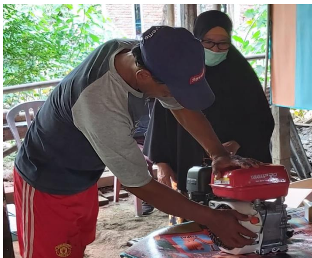
Gambar 6. Demonstrasi Perawatan Mesin Outboard oleh Peserta Kegiatan