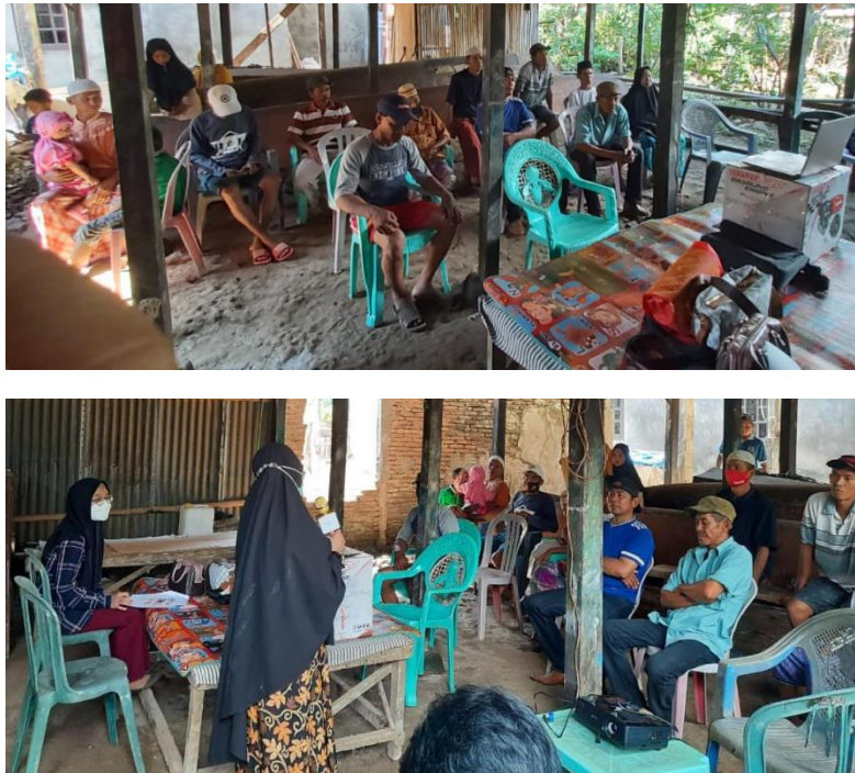
Gambar 4. Peserta Penyuluhan dan Bimbingan Metode Perbaikan dan Perawatan Mesin Outboard Kelompok Nelayan Sehati

Tahapan pelaksanaan penyuluhan dan bimbingan metode perbaikan dan perawatan mesin outboard , melibatkan tim kegiatan dan mahasiswa yang dilaksanakan di Desa Pa'benteng Kecamatan Marusu Kabupaten Maros pada bulan Juni 2021. Sasaran pelaksanaan kegiatan ini dilakukan kepada para nelayan se-Kecamatan Marusu. Kegiatan ini dilakukan dengan memberikan penjelasan dan bimbingan serta membagikan modul metode perbaikan dan perawatan mesin outboard kapal nelayan kepada para nelayan peserta kegiatan ini (Gambar 4 dan Gambar 5). Selain itu kami juga menyuruh peserta mendemonstrasikan cara perawatan mesin dan memberikan bantuan satu buah mesin out board kepada kelompok nelayan Sehati (Gambar 6 dan Gambar 7).