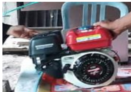
Gambar 3. Mesin Outboard 5,5 Hp

Tahapan ini meliputi persiapan materi penyuluhan dan pembuatan modul metode perbaikan dan perawatan mesin outboard yang akan diberikan pada kelompok nelayan “Sehati” serta menyiapkan mesin outboard dan tools yang akan digunakan untuk mempraktekkan cara perbaikan dan perawatan mesin outboard (Gambar 3).