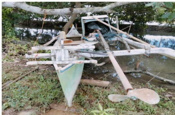
Gambar 2. Perahu Motor Tempel ( Outboard ) yang Digunakan Nelayan di Kabupaten Maros

Sebagian besar masyarakat di Desa Pa'bentengang bekerja sebagai nelayan dan budidaya rumput laut. Untuk masyarakat yang bekerja sebagai nelayan, mereka menggunakan perahu kayu sebagai sarana transportasi untuk menangkap ikan. Cara menangkap ikan bervariasi mulai dari menggunakan jaring, bilah, alat pancing dan buh. Untuk kapalnya sendiri mereka menggunakan kapal kayu. Mesin penggerak kebanyakan dipasang diatas geladak sebagai mesin ( outboard ). Mesin ini biasanya adalah mesin diesel darat yang dimodifikasi dari mesin mobil truk dimana sudut kemiringan poros baling-baling lebih dari 30 derajat terhadap permukaan air atau arah pergerakan kapal (Gambar 2). Berbagai jenis mesin penggerak perahu yang digunakan oleh nelayan dalam melaksanakan usahanya yang saat ini, mulai dari merk mesin hingga variasi daya yang dihasilkan oleh mesin itu sendiri dengan berdasarkan lama waktu penangkapan dan ukuran perahunya (Catur, 2019).