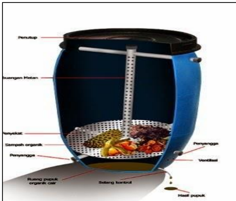
Gambar 4. Desain Alat Komposter