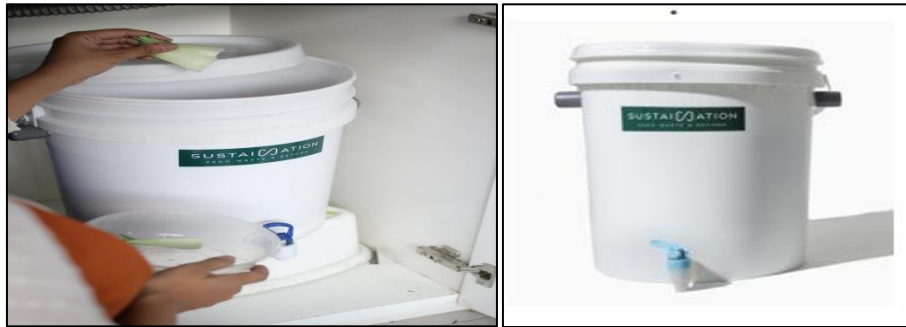
Gambar 3. Komposter Indoor Sustaination

Infrastruktur Berkelanjutan 2019 Era Revolusi Industri 4.0 Teknik Sipil dan Perencanaan 2 proses penguraian sampah. Selain itu, komposter juga mampu menjaga kelembapan dan suhu sehingga bakteri dan jasad renik dapat bekerja mengurai bahan organik secara optimal. Komposter juga memungkinkan aliran lindi terpisah dari material padat sehingga memudahkan untuk mendapatkan pupuk cair (Reza, M. 2019).