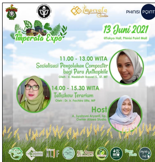
Gambar 7. Poster kegiatan sosialisasi