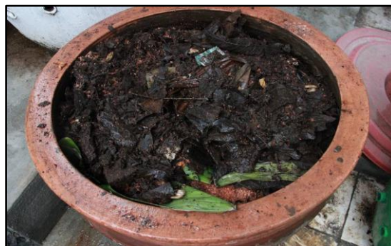
Gambar 2. Komposter Pot

Prinsip komposter gerabah adalah mengikuti kearifan lokal masyarakat Indonesia yakni membuat lubang di tanah untuk mengubur sampah. Gerabah memiliki sifat yang ‘bernafas’ sehingga memberikan sirkulasi udara yang lebih baik daripada penggunaan plastik. Komposter gerabah ini bisa dipanen saat sudah penuh.