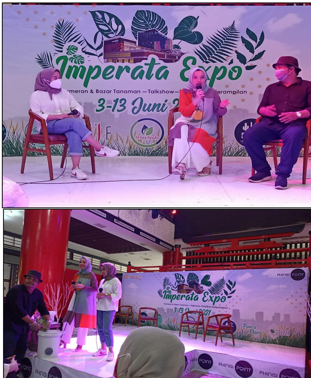
Gambar 5. Kegiatan Sosialisasi Komposter