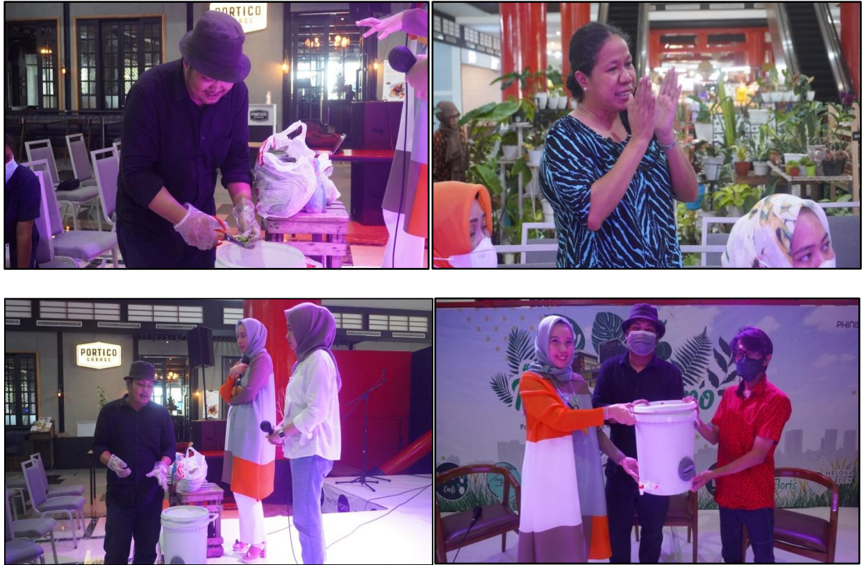
Gambar 6. Proses Pemilahan Sampah & Proses Pembuatan Kompos