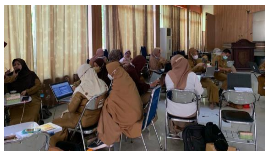
Gambar 3. Pengisian Pre-Test dan Post-Test oleh Peserta Pelatihan

Setelah pemberian materi kepada peserta selanjutnya di hari kedua pelatihan dilanjutkan dengan pemberian penugasan kepada peserta untuk melakukan diskusi kelompok dan simulasi penyusunan dokumen Rencana Strategis untuk tahun 2023-2028. Kegiatan pelatihan bimbingan teknis ini diakhiri dengan mengisi form post-test untuk mengukur peningkatan pengetahuan dan keterampilan peserta.