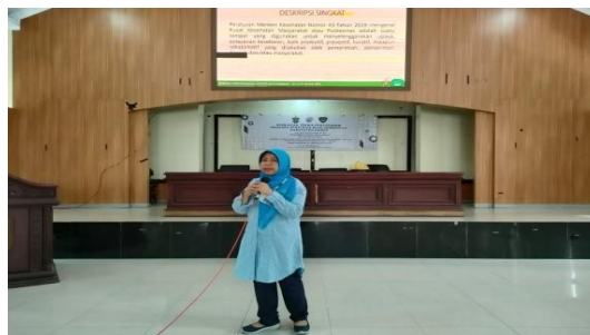
Gambar 1. Pemberian Materi kepada Peserta