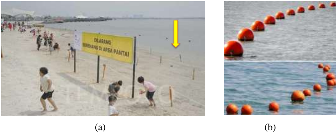
Gambar 5. (a) Contoh Penempatan Rambu Air (Bola Pelampung Laut) Batas Area Renang yang Aman di Pantai Ancol Jakarta; (B) Bola Pelampung Laut Berbahan Plastik Tahan UV

Di lokasi wisata, batas area aktivitas wisata pantai ini ditetapkan oleh pengelola atas dasar jaminan keamanan dan keselamatan pengunjung dan ditandai dengan penempatan rambu air (bola pelampung laut) berbahan plastik tahan Ultra Violet/UV (pada Gambar 5), yakni batas antara area renang dan bermain wahana, batas antara area bermain wahana dan memancing, dan batas luar area memancing. Sebaiknya penempatan rambu air ini tidak menerus sejajar garis pantai, akan tetapi terdapat jarak antaranya agar dapat dilalui oleh wahana air atau perahu nelayan. Selanjutnya, warna rambu air yang membatasi masing-masing aktivitas wisata pantai ini dibedakan guna memudahkan pemantauan oleh pengelola.