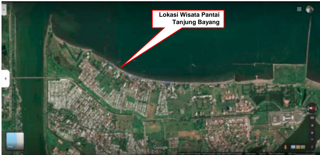
Gambar 2. Lokasi Wisata Pantai Tanjung Bayang Makassar

Sebagai kawasan wisata bahari, fenomena geologi maupun hidrometeorologi yang berdampak potensi bencana dapat terjadi di Pantai Tanjung Bayang seperti gempa bumi, tsunami, banjir bandang, cuaca ekstrem (puting beliung), gelombang ekstrem dan abrasi. Khusus fenomena cuaca ekstrem di Sulawesi Selatan ini akan menimbulkan angin kencang dan berdampak terhadap tingginya gelombang pasang sehingga akan memengaruhi aktivitas yang dilakukan di pantai dan laut, seperti aktivitas nelayan, wisatawan pantai, dan lainnya. Demikian pula dengan kondisi geomorfologi wilayah pesisir Kota Makassar adalah rawan terhadap resiko bencana (Suleman, Y., Rachman, T., Paotonan, P., 2018), rawan terhadap perubahan iklim dan tingkat kenaikan tinggi muka air laut (Umar, H., Rachman, T., dan Sari, I.P., 2019), dan merupakan salah satu