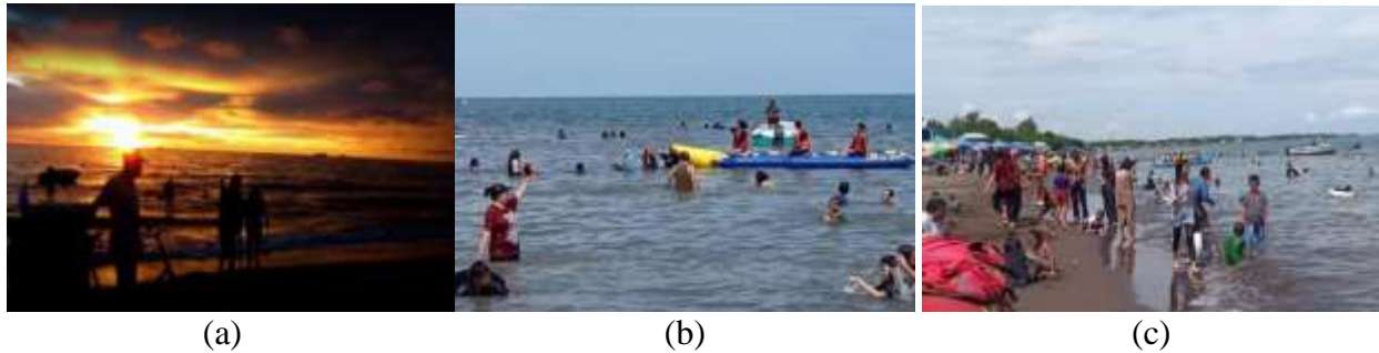
Gambar 1. (a) Keindahan Panorama, (B) Bermain Wahana, dan (C) Berenang, sebagai Daya Tarik dan Aktivitas Wisata Pantai Tanjung Bayang Makassar

keindahan sunset karena lokasinya yang menghadap ufuk barat ke Selat Makassar, dan dapat melakukan aktivitas wisata seperti berenang, banana boat dan floaties , seperti ditunjukkan Gambar 1. Lokasi wisata Tanjung Bayang dengan panjang garis pantai berkisar 923 meter ini berada di Kelurahan Tanjung Merdeka Kecamatan Tamalate Kota Makassar, sesuai Gambar 2. Kelurahan Tanjung Merdeka, Kelurahan Barombong dan Kelurahan Maccini Sombala merupakan tiga kelurahan di Kecamatan Tamalate yang memiliki akses dengan pantai (BPS, 2020).