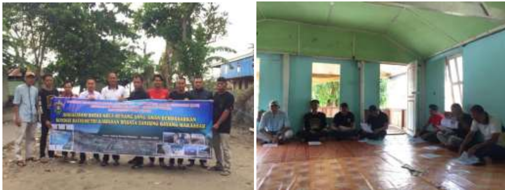
Gambar 3. Kegiatan Sosialisasi Batas Area Renang yang Aman berdasarkan Kondisi Batimetri Kawasan Wisata Pantai Tanjung Bayang

rambu/papan informasi bencana di kawasan wisata Pantai Tanjung Bayang. Produk peta ini menjelaskan kontur kedalaman kawasan wisata Pantai Tanjung Bayang dengan interval 0,2meter dan disertai dengan beberapa tinjauan profil potongan memanjang morfologi (kemiringan) pantai. Berdasarkan kondisi batimetri kawasan wisata Pantai Tanjung Bayang ini ditentukan batas area renang yang aman dengan rentang kedalaman antara 0–2,0meter, batas area bermain wahana dengan rentang kedalaman antara 2,0–4,0meter, dan batas area memancing dengan rentang kedalaman antara 4,0–7,0meter. Peta ini juga memberikan informasi bahwa jarak area renang yang aman dari garis pantai adalah \pm 200 meter, jarak bermain wahana dari batas area renang yang aman ke arah laut sebesar \pm 200 meter, dan jarak area memancing dari batas area bermain wahana ke arah laut sebesar \pm 200 meter.