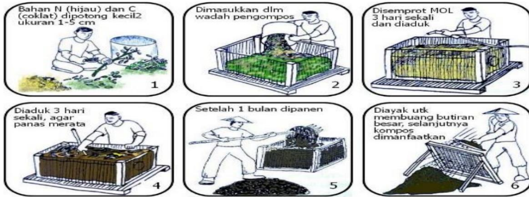
Gambar 1. Ilustrasi Pengolahan Kompos

Seringkali dalam proses pengomposan terjadi hal-hal yang kurang menyenangkan seperti, munculnya belatung, berbau dan becek. Hal ini dapat diatasi dengan menambahkan material seperti dedaunan kering, tanah hingga potongan kayu. Selain itu terdapat permasalahan mengenai wadah kompos yang seringkali bocor ataupun tidak awet. Hal ini dapat diatasi dengan membuat wadah berbahan dasar plastik HDPE (Pirlea, et al. , 2023).