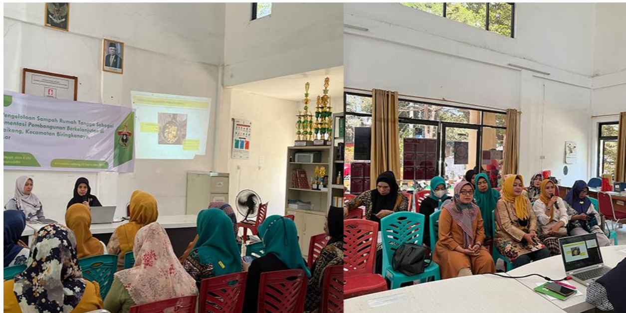
Gambar 2. Kegiatan Sosialisasi

Setelah pemaparan materi, dilakukan sesi tanya jawab. Kegiatan lalu diakhiri dengan peserta melakukan post-test guna melihat pemahaman peserta terhadap pemaparan materi yang telah diberikan.