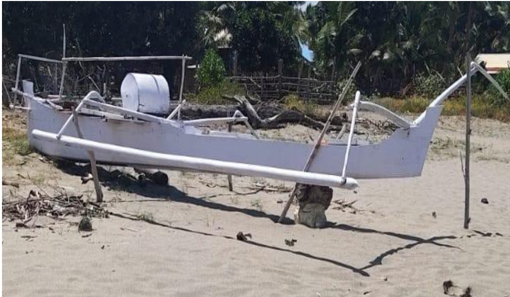
Gambar 1. Kapal Nelayan di Kab. Pinrang