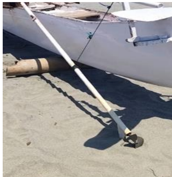
Gambar 2. Mesin Penggerak, Poros dan Baling-Baling

Keberhasilan nelayan dalam menangkap ikan ditentukan oleh laik laut tidaknya kapal yang digunakan, laik laut dalam arti memenuhi syarat teknis operasional kapal serta aman pada saat digunakan. Poros penggerak kapal atau dikenal juga sebagai poros baling-baling kapal merupakan salah satu sistem penting yang harus dipastikan dapat berfungsi dengan baik pada saat nelayan berlayar (Irwan, 2023). Daya dan torsi yang dihasilkan mesin penggerak akan ditransmisikan ke baling-baling melalui mekanisme perputaran poros, daya dan torsi tersebut akan tiba di baling-baling untuk menciptakan daya dorong yang melawan gaya hambatan kapal sehingga kapal dapat bergerak maju. (S.W. Adji, 2009).