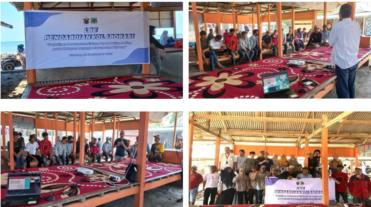
Gambar 4. Pelaksanaan Kegiatan PPM LBE – Kolaborasi Tahun 2023

Tim dosen Departemen Teknik Sistem Perkapalan Fakultas Teknik, Universitas Hasanuddin, telah mengadakan suatu kegiatan dalam upaya memenuhi unsur Tri Dharma Perguruan Tinggi pada unsur Pengabdian pada Masyarakat sebagaimana terlihat gambar 4. Kegiatan ini dilaksanakan pada hari Minggu tanggal 24 September 2023, dengan kelompok mitra masyarakat nelayan “Perahu Layar”. Kegiatan dihadiri oleh 20 orang anggota kelompok dari berbagai umur pengalaman melaut dan dilaksanakan di alun-alun wisata pantai Amanni, Mattito Tasi, Mattiro Sompe, Kabupaten Pinrang.