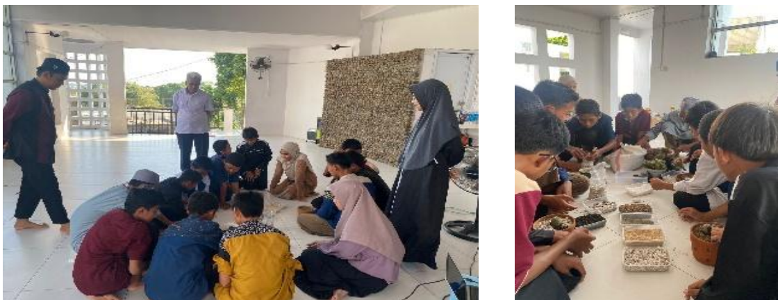
Gambar 3. Proses Pelatihan Lansekap Mini

Setelah semua bahan dibagikan, selanjutnya masing masing kelompok diberi kesempatan selama kurang lebih 60 menit untuk membuat lansekap mini sesuai dengan kreasi mereka masing masing. Pada tahap ini masing masing kelompok diberi kesempatan terlebih dahulu untuk berdiskusi tentang tema yang akan di buat. Terlihat bahwa ada kelompok yang cepat dalam memikirkan temanya dan langsung menuangkan idenya dengan langsung membuat karyanya. Sementara ada kelompok yang berdiskusi terlebih dahulu, kegiatan ini diberikan pada Gambar 3.