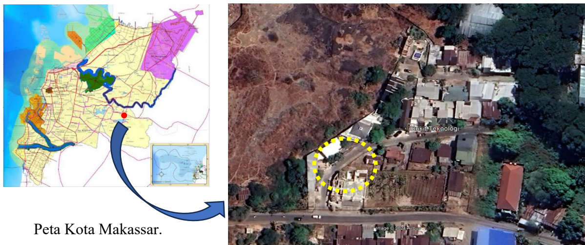
Peta Kota Makassar.

Kegiatan pengabdian masyarakat ini dilaksanakan di Pondok Tahfiz Al-Qur'an Ibnu Abbas di Pondok Jabal Hira yang terletak di jalan Nipa nipa Antang kecamatan Manggala Makassar (diberikan pada Gambar 1). Lokasi pondok merupakan lokasi yang strategis karena berada di daerah ketinggian dengan view lingkungan yang menarik. Pada pondok ini terdapat mesjid, bangunan tidur santri, dan saat ini sedang dikembangkan dengan membangun sarana baru berupa tambahan asrama dan ruang kelas untuk santri.