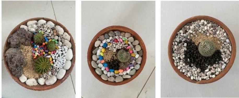
Gambar 4. Produk Lansekap Mini

Produk yang dihasilkan dapat dilihat pada Gambar 4, dimana para Hafiz dan seorang Ustadz yang juga ikut pelatihan ini. Setelah selesai mereka diminta untuk menjelaskan ide lansekap mini mereka masing masing.