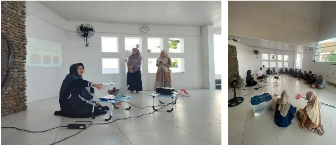
Gambar 2. Penjelasan Kegiatan

Kemudian para santri dibagi atas 4 kelompok, sehingga masing masing kelompok terdiri atas 3 santri. Setelah masing masing santri membentuk kelompok, masing masing kelompok diberikan bahan untuk pembuatan lansekap mini yang terdiri atas: