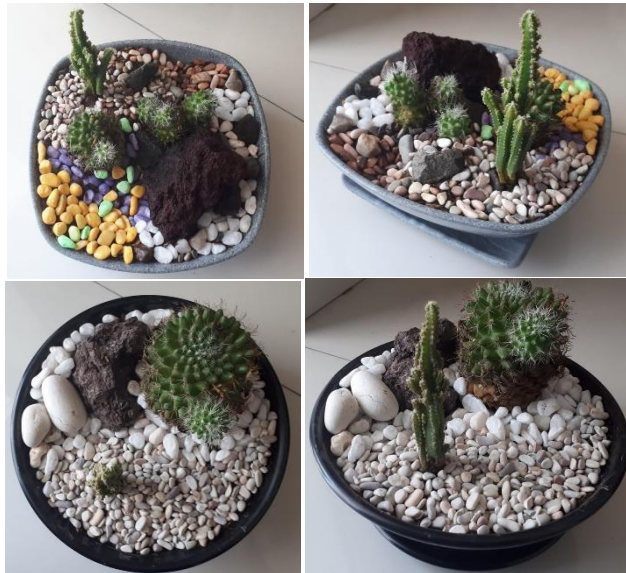
Gambar 5. Pelatihan Lansekap Mini oleh Instruktur

Lansekap mini yang dibuat untuk restorasi atensi ini adalah dari bahan-bahan natural, dan dapat dipelihara pertumbuhan tanamannya. Digunakan untuk di dalam dan di luar ruangan. Fungsinya selain untuk restorasi atensi, menghasilkan oksigen, juga memperindah ruangan, sekaligus bernilai ekonomi tinggi. Alternatif produk lain yang dibuat oleh instruktur dapat dilihat pada Gambar 5.