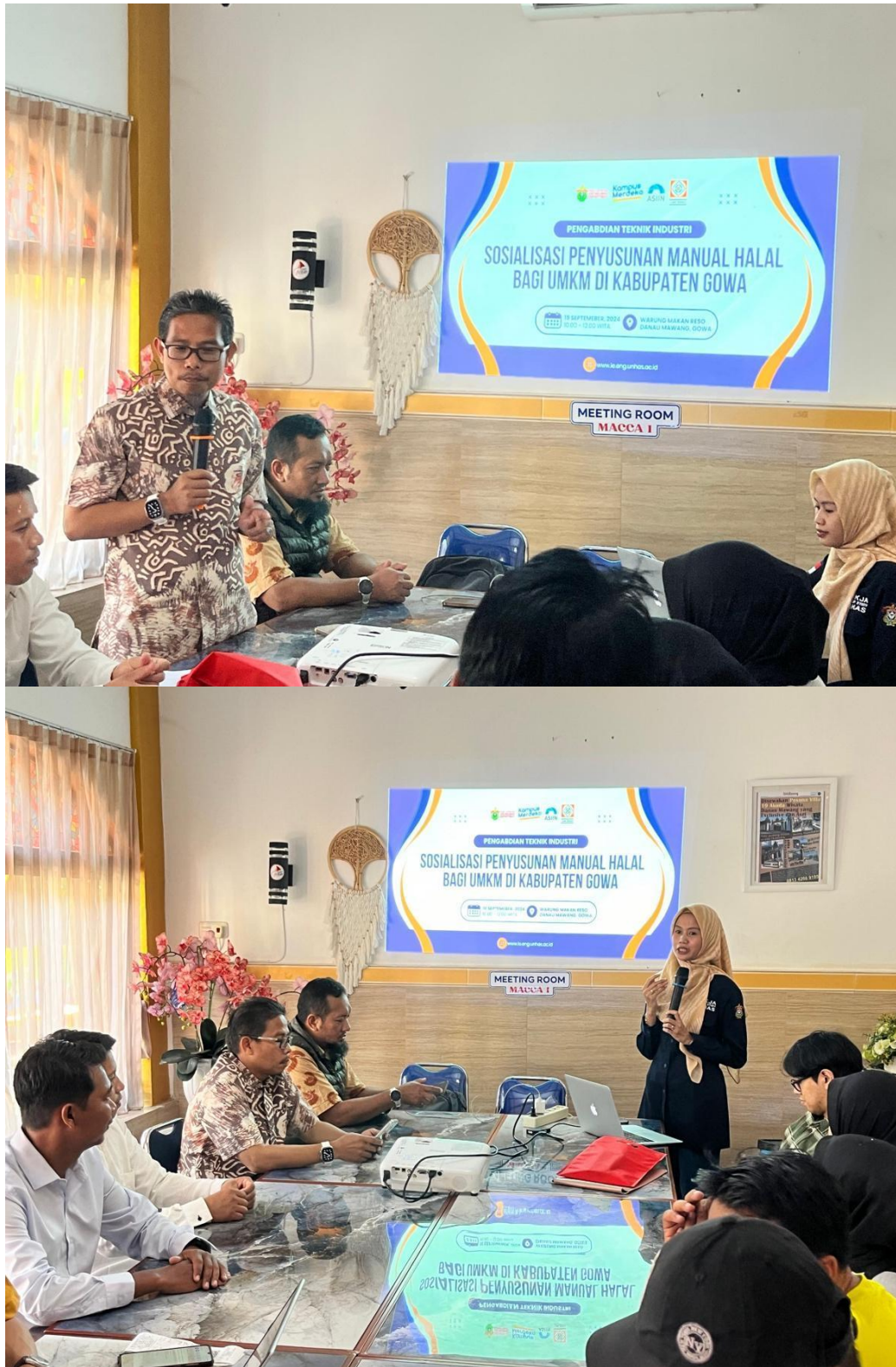
Gambar 2. Kegiatan Sosialisasi Penyusunan Manual Halal