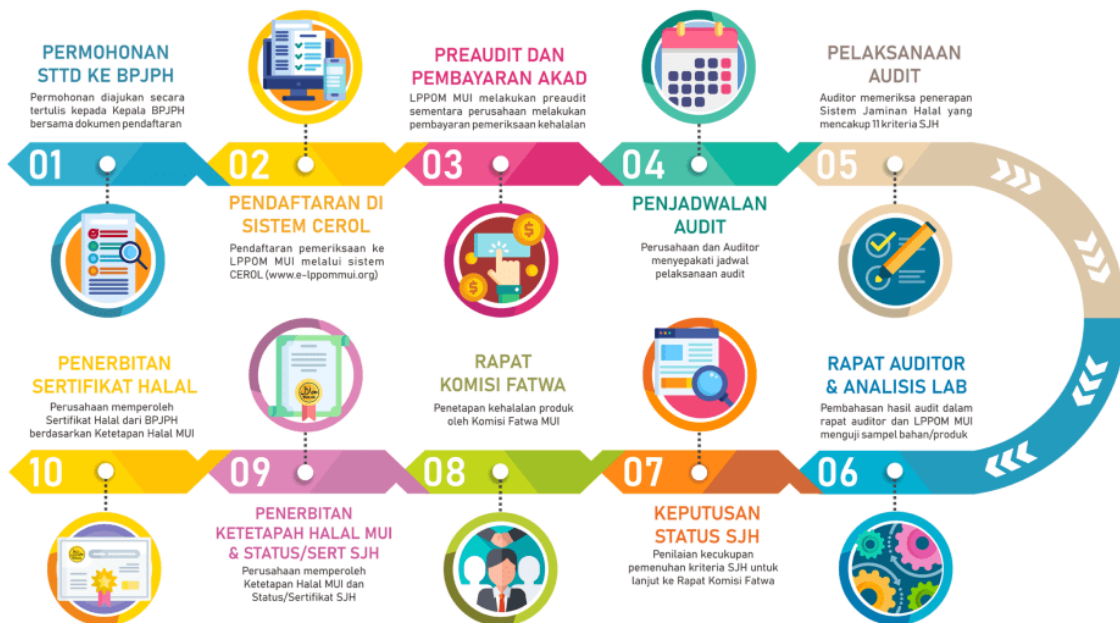
Gambar 1. Prosedur Sertifikasi Halal