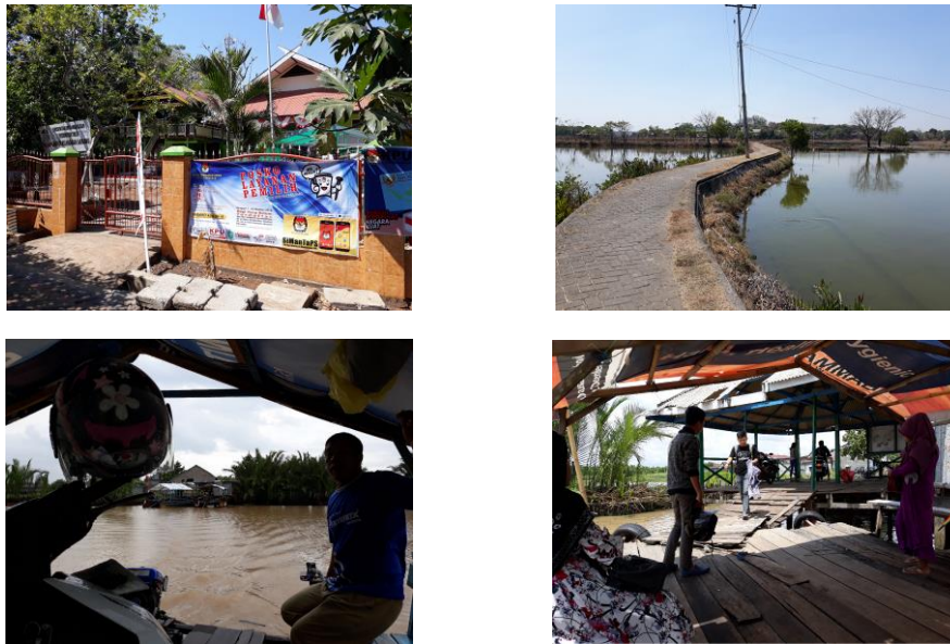
Gambar 7. Permohonan izin kegiatan pengabdian dan interview identifikasi permasalahan kelompok moda waterway

Setelah izin rekomendasi kegiatan diperoleh, selanjutnya dilakukan wawancara dengan kelompok pemilik moda waterway Sungai Tallo dan warga Kelurahan Lakkang. Tim menyampaikan maksud dan tujuan kegiatan diseminasi serta mengidentifikasi permasalahan yang dialami oleh pemilik/operator moda waterway yang seluruhnya bermukim di Pulau Lakkang di RW 03 Kelurahan Lakkang. Rangkaian aktivitas ini ditunjukkan dengan dokumentasi Gambar 7.