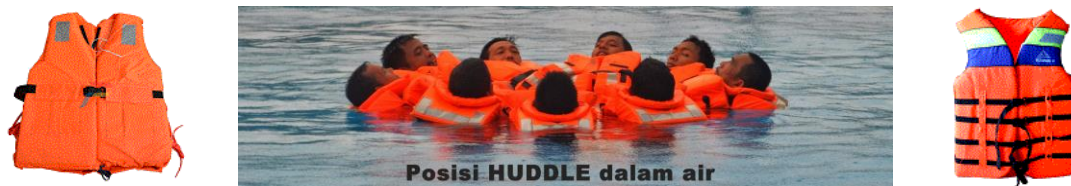
Gambar 3. Praktek penggunaan life jacket yang benar

Persyaratan baju pelampung ini memiliki ketentuan yakni: (1) Dibuat dari bahan serat sintetis keras yang membungkus sumber daya apung, seperti busa atau bilik udara; (2) Dibuat dari bahan yang baik dan dikerjakan dengan sempurna; (3) Mampu mengangkat muka orang dari dalam air; (4) Tidak rusak oleh pengaruh minyak; (5) Berwarna mencolok; (6) Tahan lompatan dari ketinggian 4,5 meter; (7) Dilengkapi dengan peluit; dan (8) Dilengkapi dengan alat penantul cahaya/ reflector . Tape "SOLAS" retroreflective dijahit pada kain agar terlihat dalam kegelapan ketika cahaya pencarian bersinar ke arah pemakainya. Bentuk yang paling sederhana untuk baju pelampung yakni terbuat dari busa steriofoam yang dibungkus di dalam baju pelampung. Banyak digunakan sebagai perangkat keselamatan kapal, bis air, dan perahu.