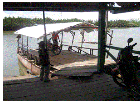
Gambar 1. Kondisi moda waterway Sungai Tallo yang tidak dilengkapi perangkat keselamatan di perairan Sungai Tallo dan Dermaga Kera-kera

Keluhan salah satu pemilik moda waterway Sungai Tallo telah disampaikan tentang tata cara proses evakuasi penumpang seandainya terjadi kecelakaan di perairan sungai. Pemilik moda ini