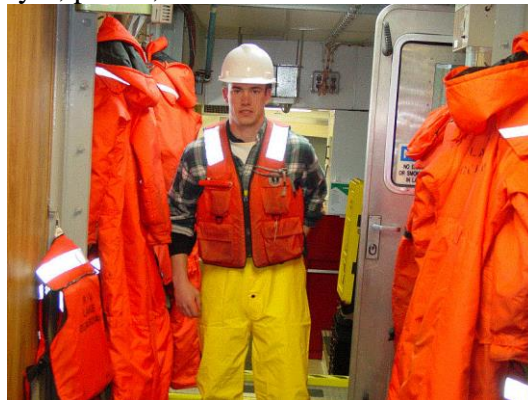
Gambar 2. Salah satu bentuk life jacket

Baju pelampung merupakan perangkat yang dirancang untuk membantu pemakai, baik secara sadar atau di bawah sadar, untuk tetap mengapung dengan mulut dan hidung berada di atas permukaan air pada saat berada dalam air, sesuai Gambar 2 dan 3. Perangkat ini harus disetujui oleh pihak yang berwenang dalam hal ini Biro Klasifikasi Indonesia untuk digunakan oleh sipil dalam aktifitas rekreasi berlayar, pelaut, dan lain-lain.