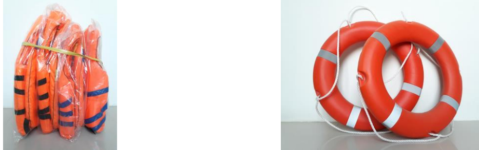
Gambar 8. Pengadaan peralatan keselamatan pelayaran moda transportasi waterway