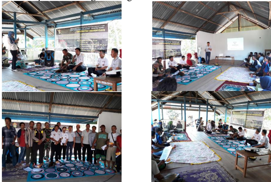
Gambar 9. Suasana diseminasi