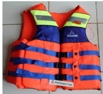
Gambar 6. Baju pelampung produk ATUNAS

Baju pelampung dirancang untuk memungkinkan kebebasan bergerak sambil menyediakan pengguna dengan daya apung yang diperlukan. Alat ini dirancang untuk pemeliharaan minimal dan karena produk terbuat dari busa dan dapat diproduksi massal dengan murah. Daya tahan maksimum baju pelampung ini hingga jangka waktu daya tahan maksimum yakni 10 tahun. Jenis produk ini semuanya bebas pemeliharaan, namun inspeksi visual tahunan dianjurkan. Semua perawatan yang diberikan terhadap baju pelampung akan memperpanjang penggunaannya. Tidak ada tanggal kadaluarsa untuk perangkat keselamatan ini dan dibuang untuk didaur ulang.