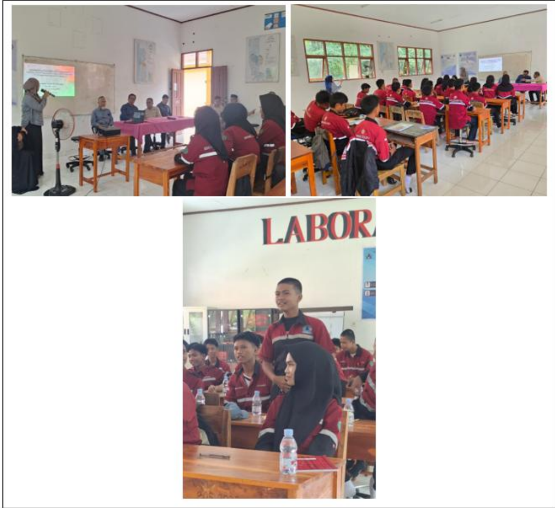
Gambar 9. Pemaparan Materi Pelatihan oleh Tim Pengabdian Departemen Teknik Pertambangan