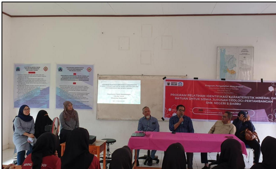
Gambar 5. Sambutan oleh Kepala SMK Negeri Barru