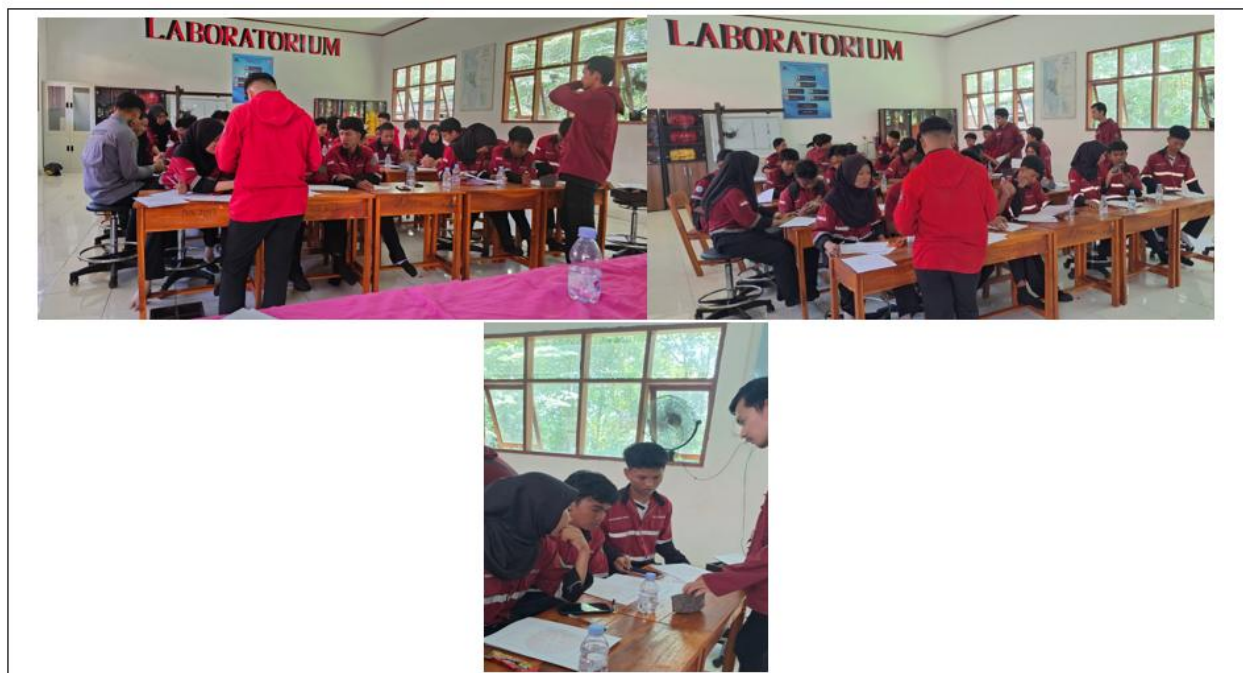
Gambar 12. Pendampingan Pelatihan Deskripsi Mineral dan Batuan oleh Tim Pengabdian Departemen Teknik Pertambangan