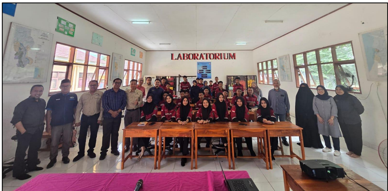
Gambar 14. Sesi Foto Bersama

Sebelum mengakhiri pelatihan, tim pengabdian terlebih dahulu memberikan overview dan menyimpulkan seluruh kegiatan. Acara kemudian ditutup dengan sesi foto bersama (Gambar 14).