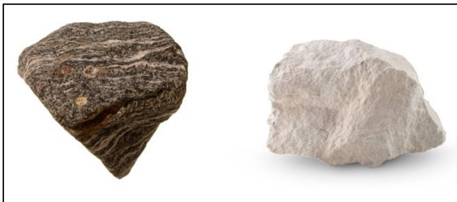
Gambar 3. Contoh Batuan Metamorf (Jerram & Caddick, 2022)

Siklus batuan menggambarkan hubungan dinamis antara ketiga jenis batuan, di mana batuan dapat berubah bentuk dan jenisnya seiring waktu melalui proses geologi seperti pelapukan, erosi, sedimentasi, metamorfosis, dan peleburan. Setiap batuan menyimpan catatan unik tentang kondisi lingkungan pada saat pembentukannya, sehingga mempelajari batuan tidak hanya membantu memahami sejarah bumi, tetapi juga sangat penting dalam eksplorasi sumber daya alam seperti mineral, minyak bumi, dan gas alam (Neukirchen, 2022).