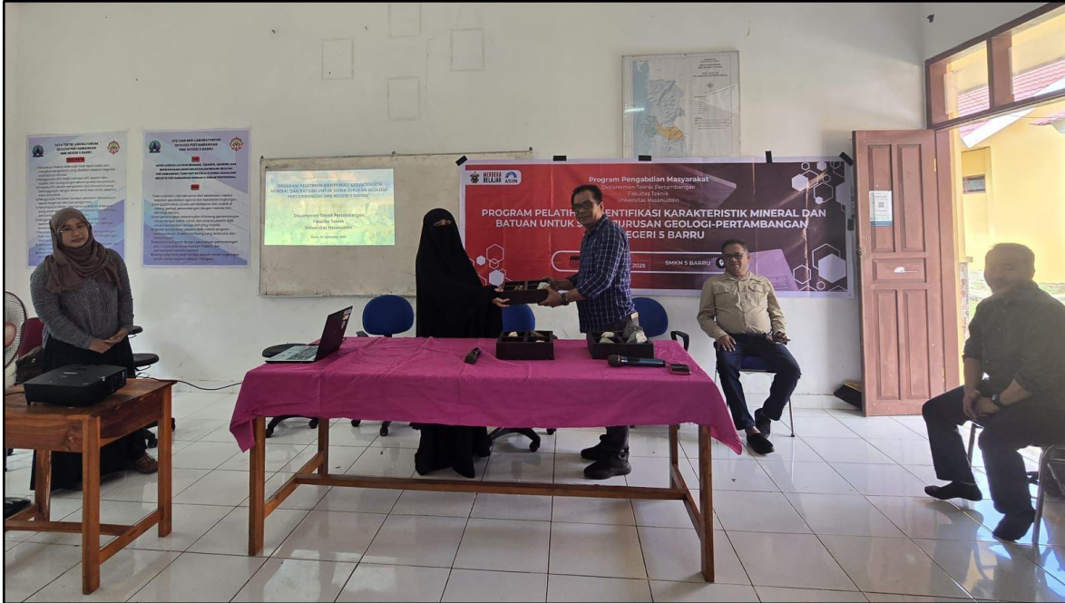
Gambar 6. Penyerahan 12 Sampel Batuan Secara Simbolis Kepada SMK Negeri 5 Barru

Pelatihan diawali dengan pelaksanaan pre-test berbentuk soal pilihan ganda seputar materi batuan dan mineral (Gambar 7). Tes awal ini bertujuan untuk mengukur pemahaman awal para peserta siswa sebelum mereka menerima materi pelatihan (Gambar 8).