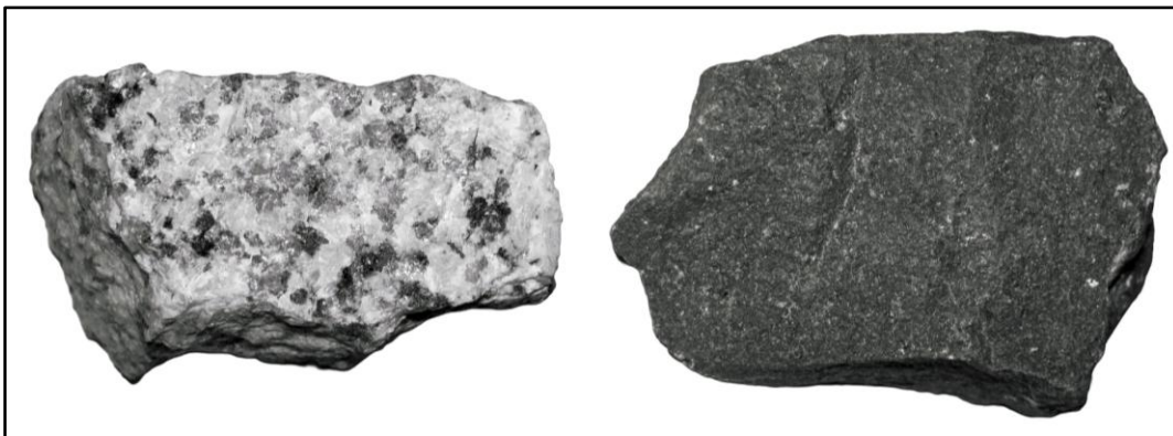
Gambar 1. Contoh Batuan Beku (Peters et al. , 2021)