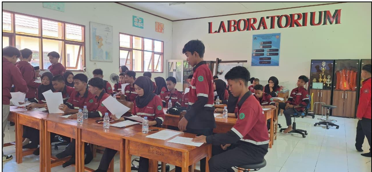
Gambar 13. Suasana Post-Test Setelah Pelatihan dilaksanakan

Sebelum mengakhiri pelatihan, tim pengabdian terlebih dahulu memberikan overview dan menyimpulkan seluruh kegiatan. Acara kemudian ditutup dengan sesi foto bersama (Gambar 14).