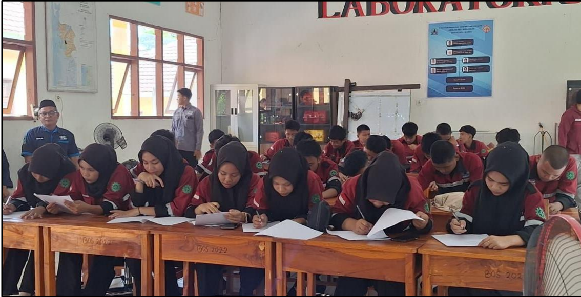
Gambar 8. Suasana Pre-Test yang dilakukan Sebelum Pelatihan Deskripsi Batuan dan Identifikasi Mineral dilakukan