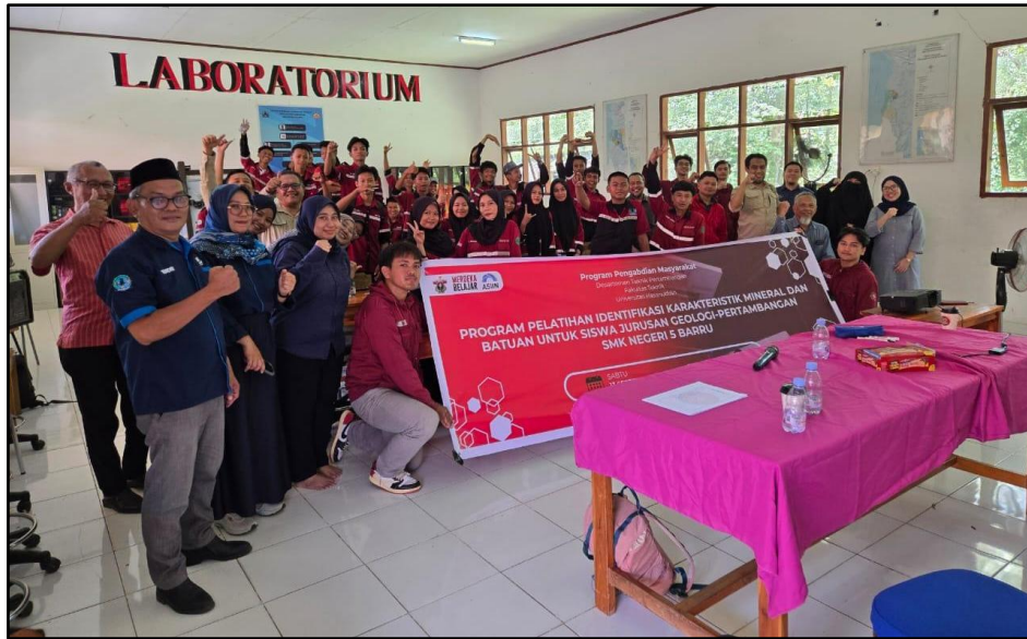
Gambar 4. Tim Pengabdian Kepada Masyarakat Departemen Teknik Pertambangan dan Peserta Pelatihan

Pelatihan ini dilaksanakan dalam dua tahap utama, yaitu penyampaian materi oleh dosen Departemen Teknik Pertambangan dan sesi tutorial praktis mengenai metode mendeskripsikan sifat fisik mineral dan batuan. Materi yang disampaikan mencakup konsep dasar mineral dan batuan, klasifikasi jenis-jenis batuan, teknik deskripsi batuan, serta metode identifikasi mineral. Selanjutnya, peserta mengikuti tutorial langsung dengan menggunakan perangkat peraga yang disediakan oleh Departemen Teknik Pertambangan, yang terdiri dari 12 sampel batuan yang mewakili tiga jenis utama, yaitu batuan beku, sedimen, dan metamorf. Seluruh perangkat peraga ini kemudian dihibahkan kepada sekolah untuk mendukung kegiatan belajar mengajar, seperti yang terlihat pada Gambar 6. Untuk mengukur efektivitas pelatihan, evaluasi pemahaman peserta dilakukan melalui pre-test sebelum kegiatan dan post-test setelah pelatihan berakhir.