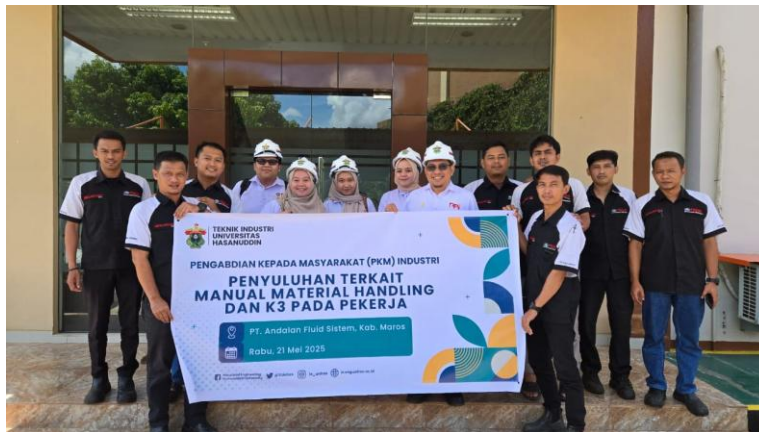
Gambar 1. Foto Bersama Peserta