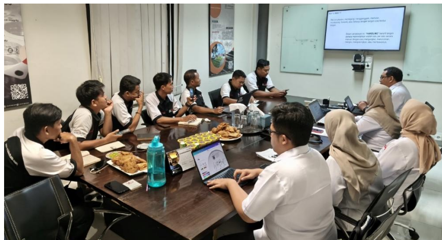
Gambar 2. Kegiatan Penyuluhan MMH dan K3

Pelaksanaan kegiatan ini mencakup beberapa tahapan, yaitu pre-test , penyuluhan berupa pemaparan materi, dan post-test , yang dirancang untuk mengevaluasi tingkat peningkatan pengetahuan pekerja setelah menerima materi. Proses pelaksanaan kegiatan penyuluhan dalam kegiatan ini dapat dilihat pada Gambar 2.