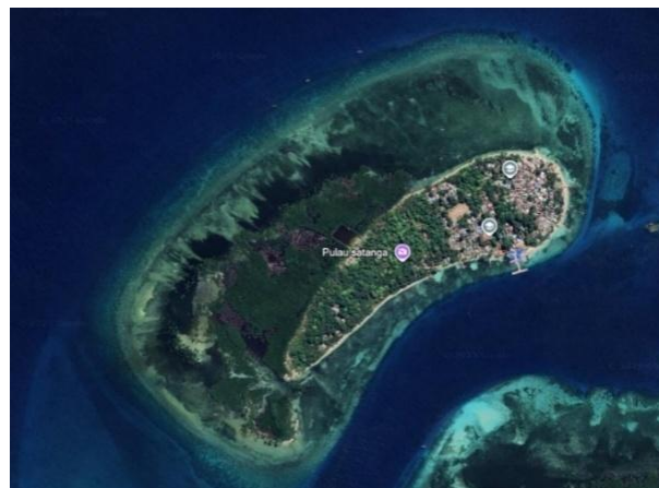
Gambar 1. Tangkapan Layar Google Earth Pulau Satangnga

Desa Mattiro Baji, Kecamatan Kepulauan Tanakeke, yang terletak di Pulau Satangnga, Kabupaten Takalar, merupakan salah satu desa kepulauan yang telah memiliki sistem PLTS sebagai sumber listrik utama. Namun, hasil observasi awal menunjukkan bahwa sebagian besar sistem pembangkit tidak berfungsi optimal akibat kerusakan inverter, penurunan kapasitas baterai, serta panel surya yang tidak pernah dibersihkan dan terhalang vegetasi. Kondisi geografis desa yang terpisah dari daratan utama (Tiro, 2022), sebagaimana ditunjukkan pada Gambar 1, memperkuat ketergantungan masyarakat terhadap sistem PLTS yang ada di pulau.