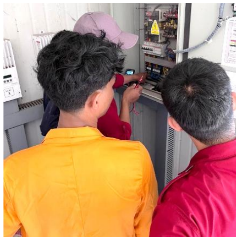
Gambar 5. Tim Pengabdian Memeriksa Kondisi PLTS

Kegiatan pengecekan teknis dilakukan satu kali secara menyeluruh terhadap seluruh sistem pembangkit listrik yang ada di Desa Mattiro Baji, mencakup PLTS induk berkapasitas 30 kWh, satu unit PLTS kecil, dan satu genset yang berfungsi sebagai sumber cadangan listrik bagi masyarakat. Pemeriksaan dilaksanakan oleh tim bersama masyarakat dan aparat desa untuk menilai kondisi aktual peralatan serta mengidentifikasi penyebab utama menurunnya kinerja sistem kelistrikan di pulau tersebut. Dokumentasi pengecekan teknis PLTS 30 kWh ditunjukkan pada Gambar 5.