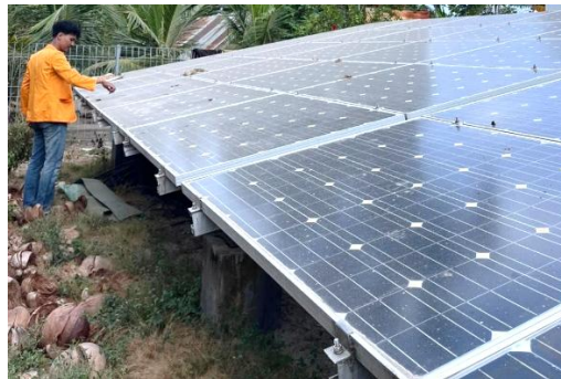
Gambar 2. Kondisi Fisik Panel Surya Induk yang Sudah Tidak Berfungsi

sistem tersebut tidak lagi beroperasi. Beberapa faktor penyebab yaitu Solar Charge Controller (SCC) yang korsleting (pernah terbakar), penurunan kapasitas baterai, serta tidak adanya kegiatan perawatan panel secara rutin. Sistem ini dulunya menjadi sumber listrik utama bagi masyarakat desa dalam memenuhi kebutuhan energi harian.