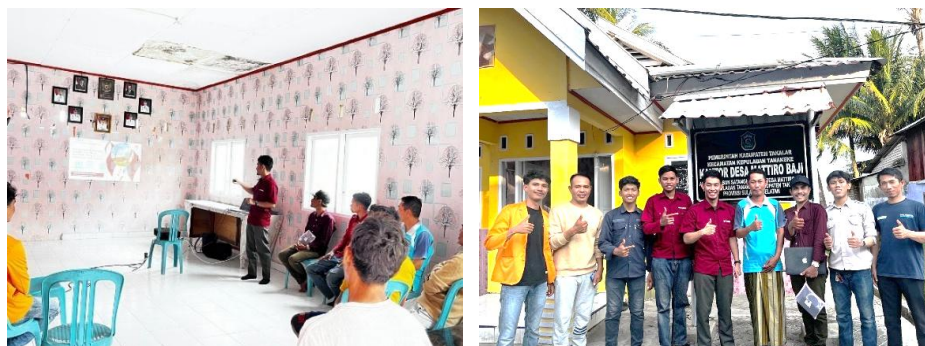
Gambar 3. (a) Kiri: Kegiatan Edukasi, (b) Kanan: Foto Bersama dengan Kades

Kegiatan edukasi dan pendampingan yang didokumentasikan pada Gambar 3 dilaksanakan melalui metode partisipatif dan demonstratif. Masyarakat diberikan materi serta dilibatkan langsung dalam praktik perawatan sistem PLTS. Tim pengabdian menjelaskan prinsip dasar kerja panel surya, pentingnya kebersihan permukaan panel, serta cara sederhana memeriksa sambungan kabel dan kapasitas baterai. Pelatihan dilakukan di balai desa dan diikuti oleh perwakilan kepala desa (Kades), kelompok masyarakat, serta yang bertugas sebagai operator listrik lokal.