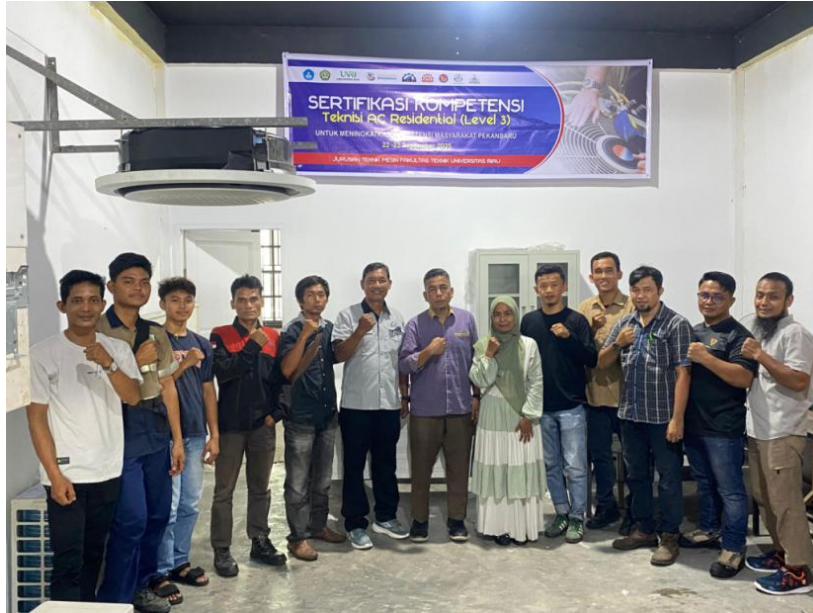
Gambar 2. Instruktur, Peserta, Asesor dan Panitia pada Akhir Kegiatan Pelatihan Teknisi AC Residential (Level 3) Tahun 2025